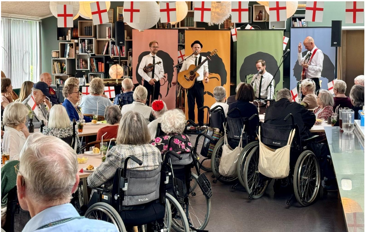
Engelsk temadag i Kulturhuset med The Beatles-kopiband-