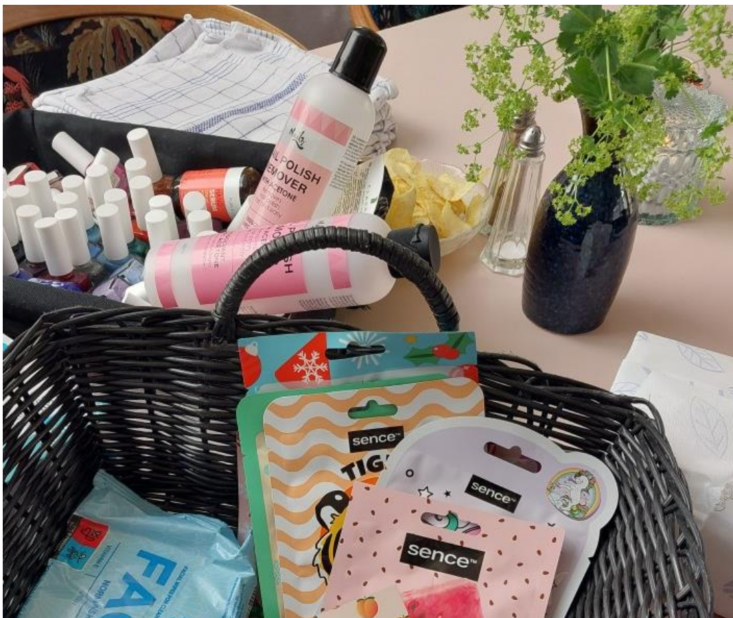
Wellness-kur- vene i Kultur- huset blev brugt i juni måned.