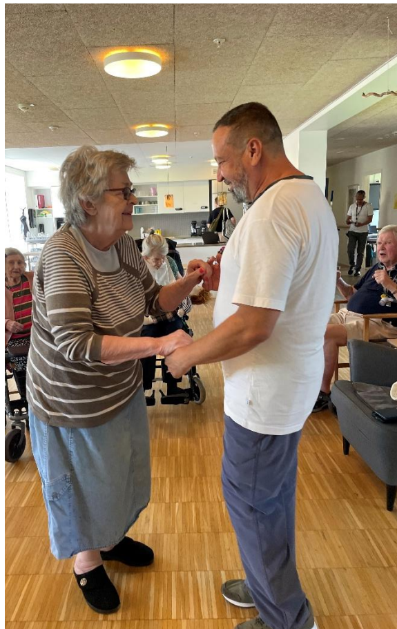
På Afde- ling D fej- rede de både EM i herrefod- bold og fik danset.