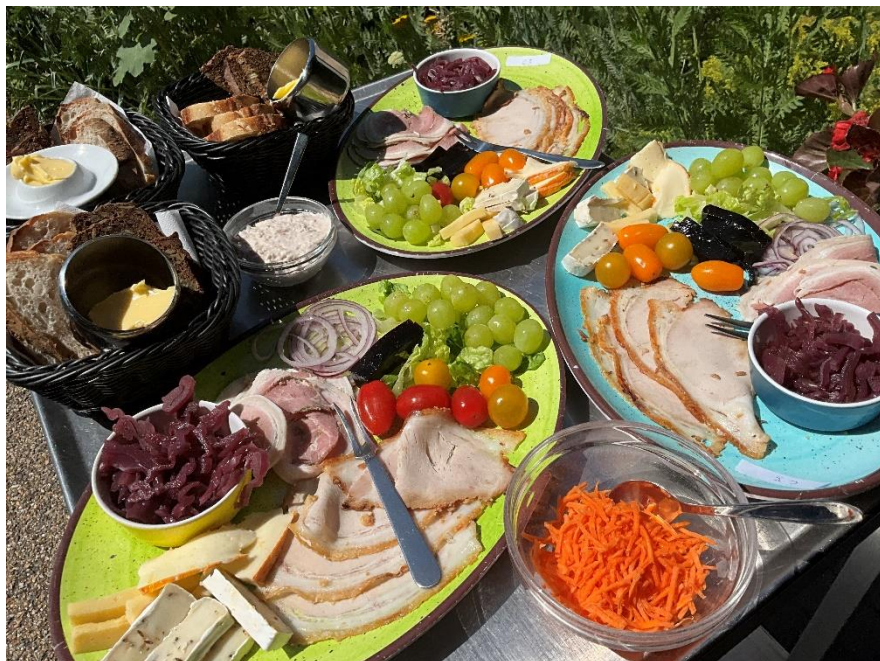
Frokost på terrassen ved Afdeling C