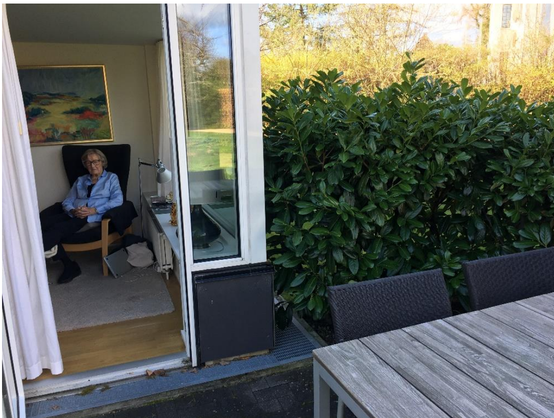
Mie nyder sin terrasse på Holmegårdsparken.

Da børnene var blevet store og var i gang med deres uddannelse, drev jeg min egen modeforretning på Jægersborg Allé 29. Det var dejligt og morsomt at være sin egen direktør, og jeg nød forholdet til kunderne. Jeg har altid bestræbt mig på at sige min ærlige mening om tøj til kunderne på en diskret måde.