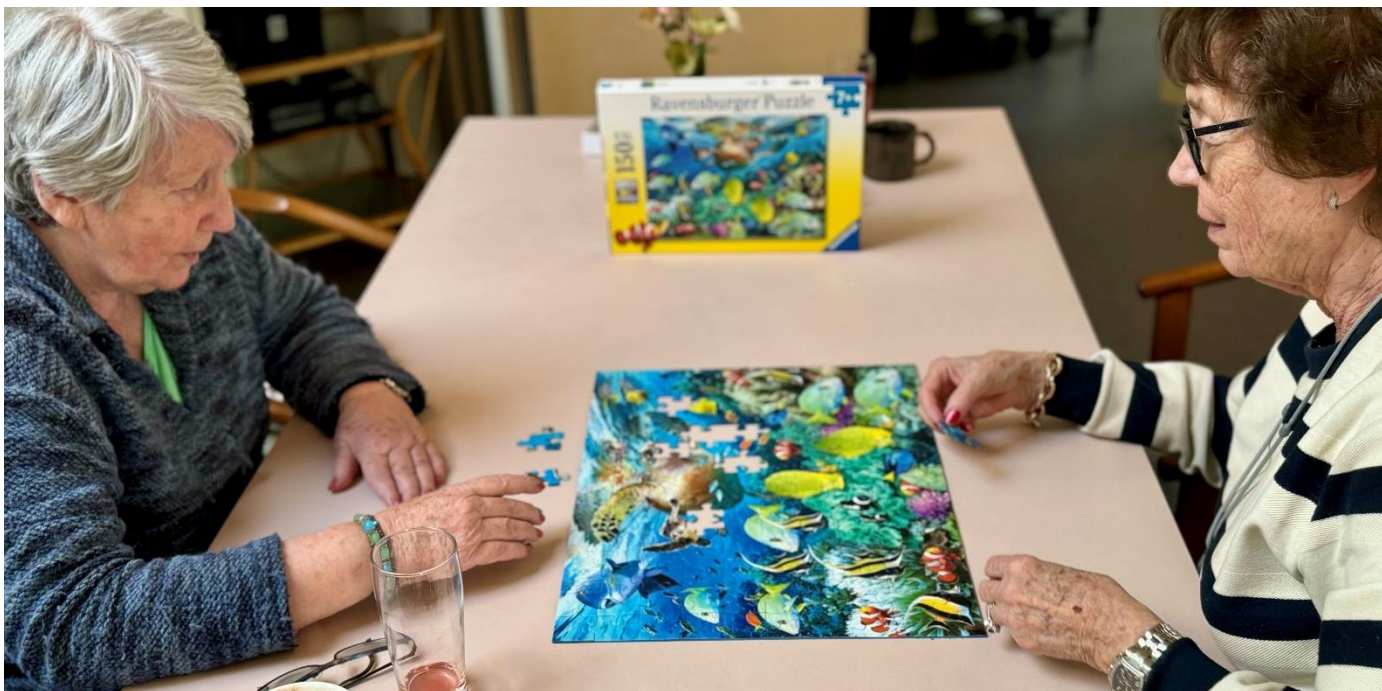
Puslespil er altid populært.