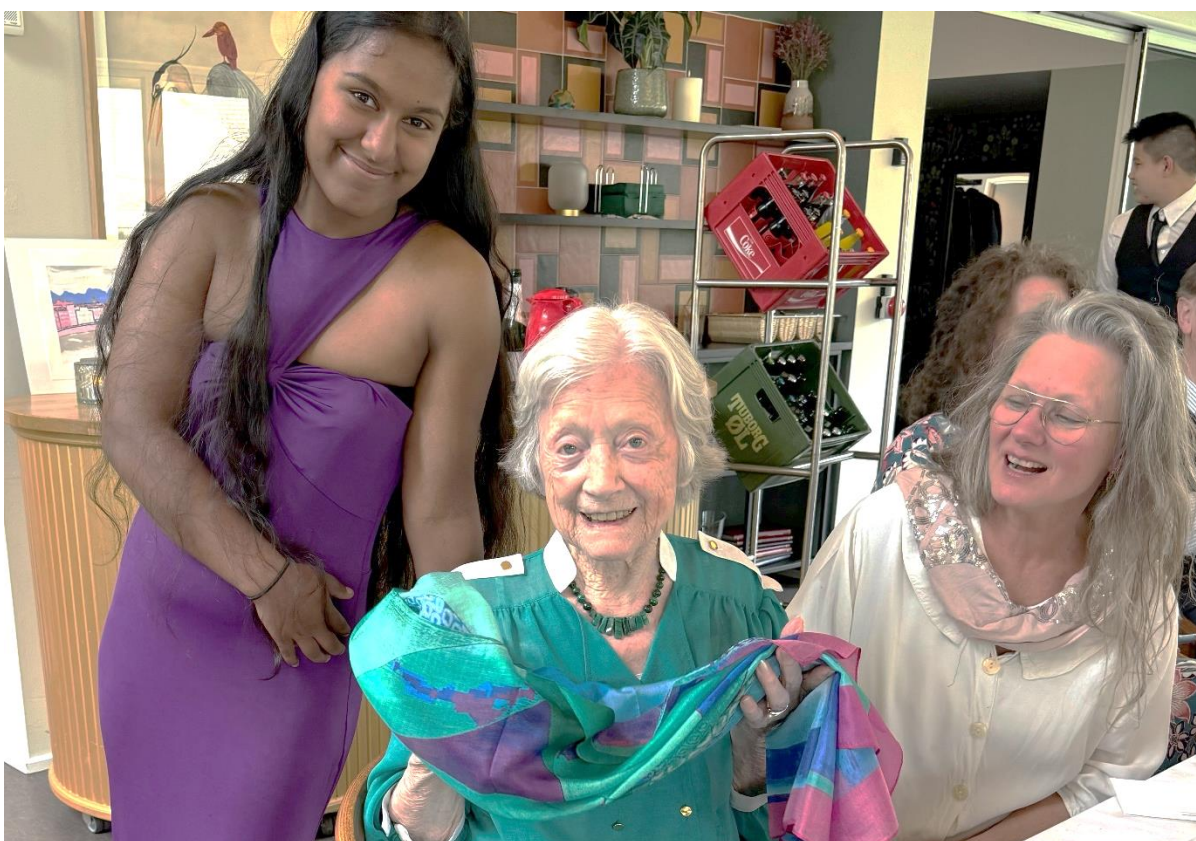
Edith fra Afdeling B, her i grøn kjole, fyldte 100 år den 16. april og blev fejret af sin familie i Kulturhuset.