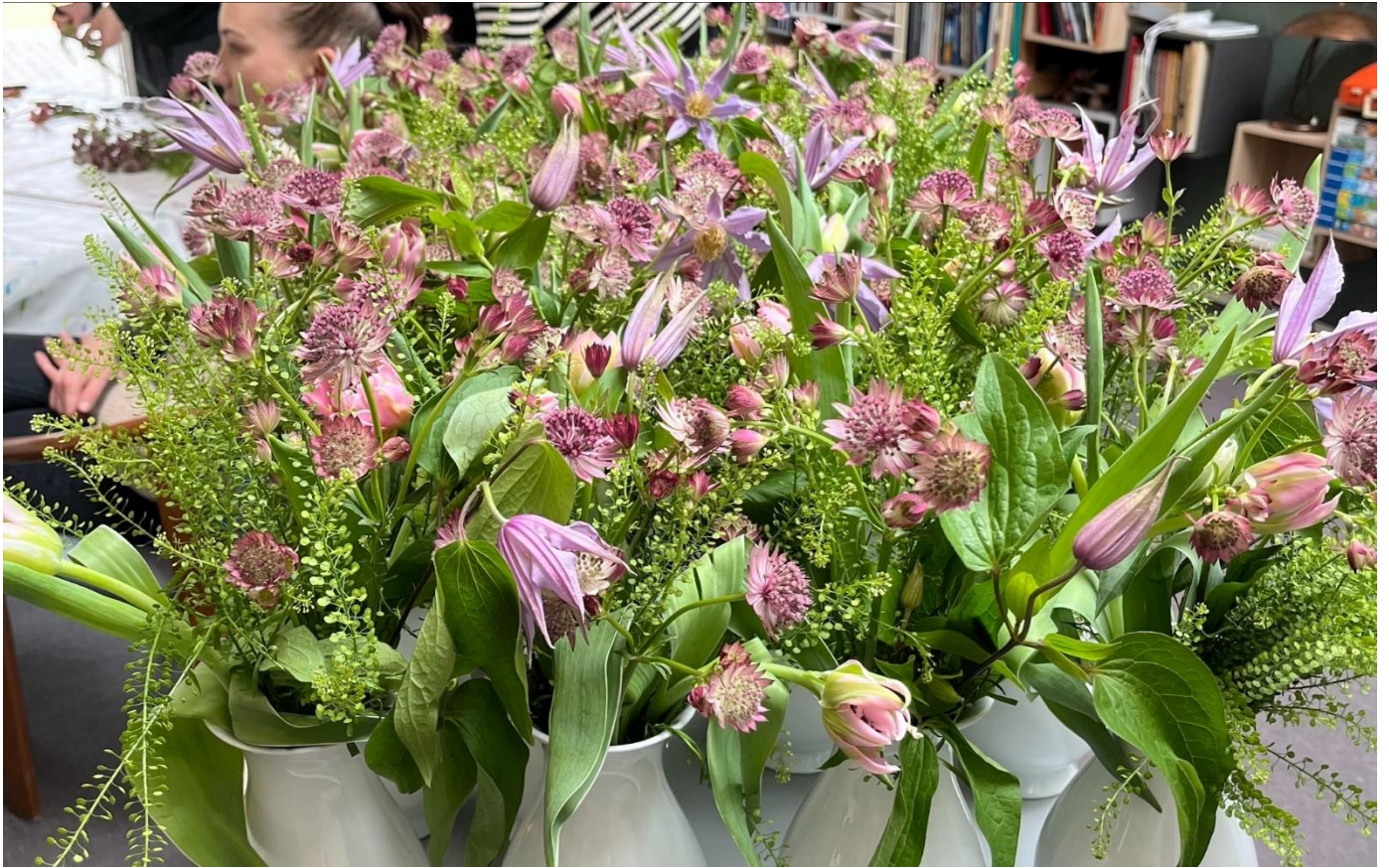
Smukke buketter som beboere og medarbejdere har lavet til afdelingerne.