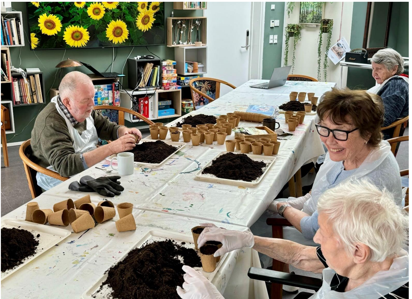
Mange var glade for plantesåningsdagen.