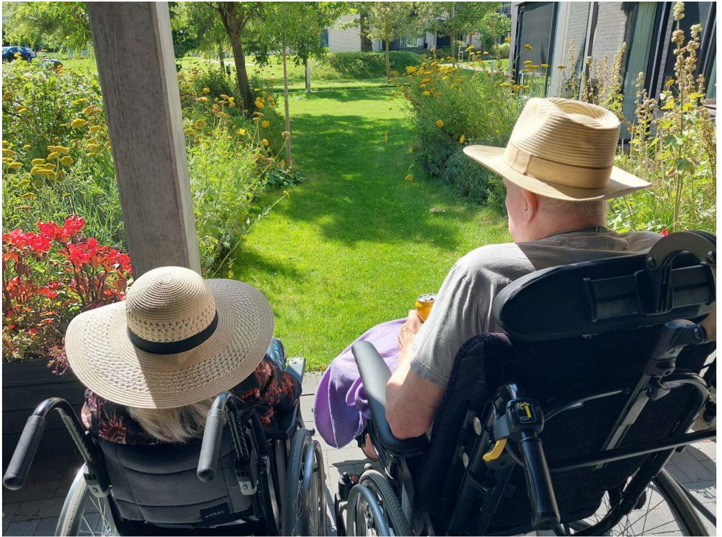
En dejlig august-søndag på Afdeling C's terrasse med udsigt til parken.