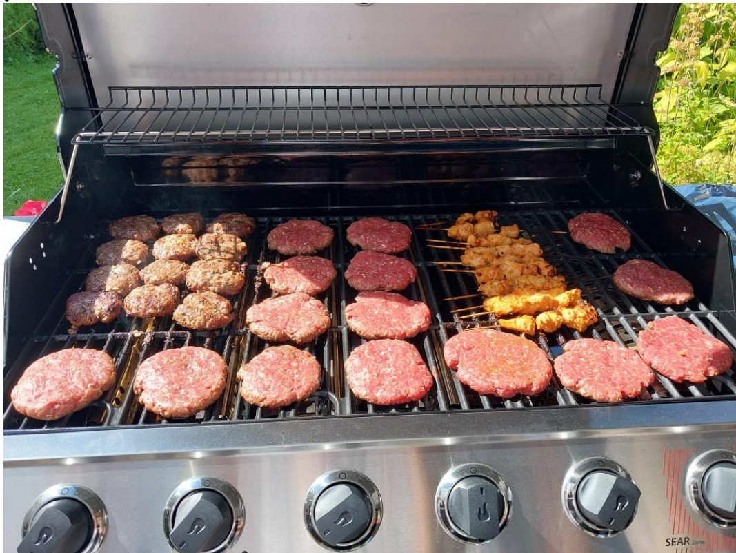
En del afdelinger har grillet her i sommer. Her er det foto fra en grill-frokost i Afdeling C.