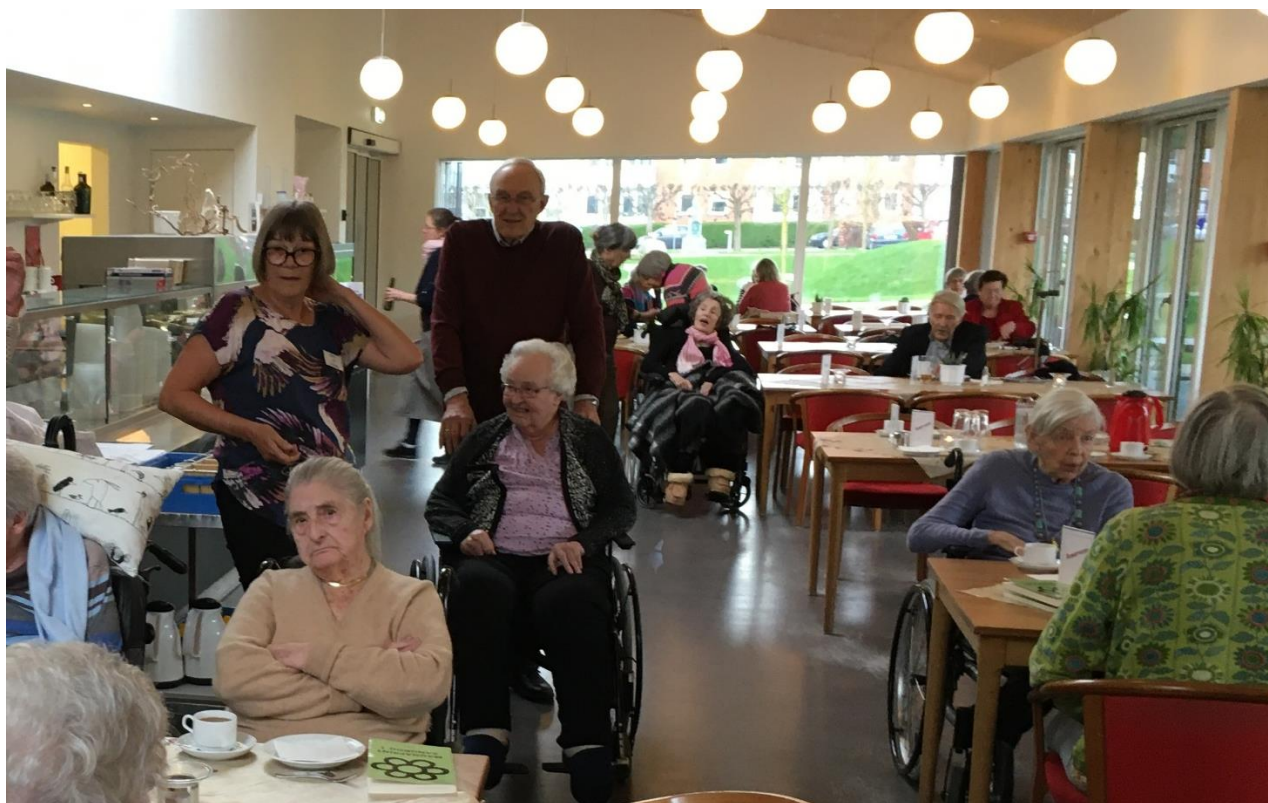
Dansearrangement i caféen på Holmegårdsparken d. 9. marts 2020 – de frivillige havde arrangeret det og hjalp til på dagen.

Vi skal være lidt mere kreative for at arrangere noget her under corona-pandemien. Selvom jeg synes, at vi når meget, er der en grænse for, hvor meget vi kan gøre, når vi ikke rigtigt kan komme indenfor. Og så nærmer vi os jo vinterhalvåret, hvor vejret bliver mere afgørende for, om vi kan gennemføre arrangementer.