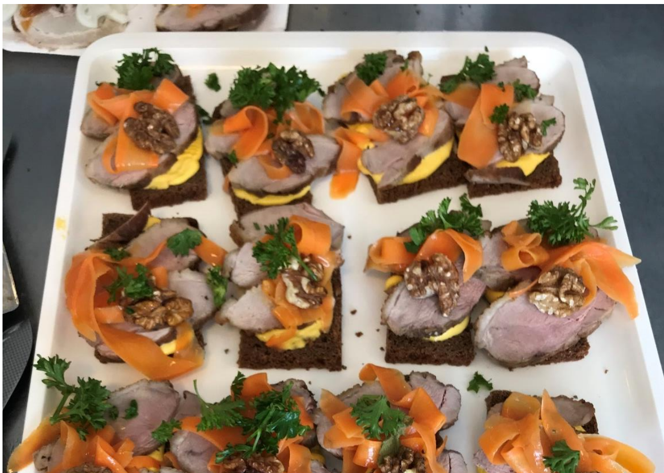
Smørrebrød fra Holmegårdsparkens køkken i august: Stegt andebryst pyntet med bl.a. rå, marinerede gulerødder.