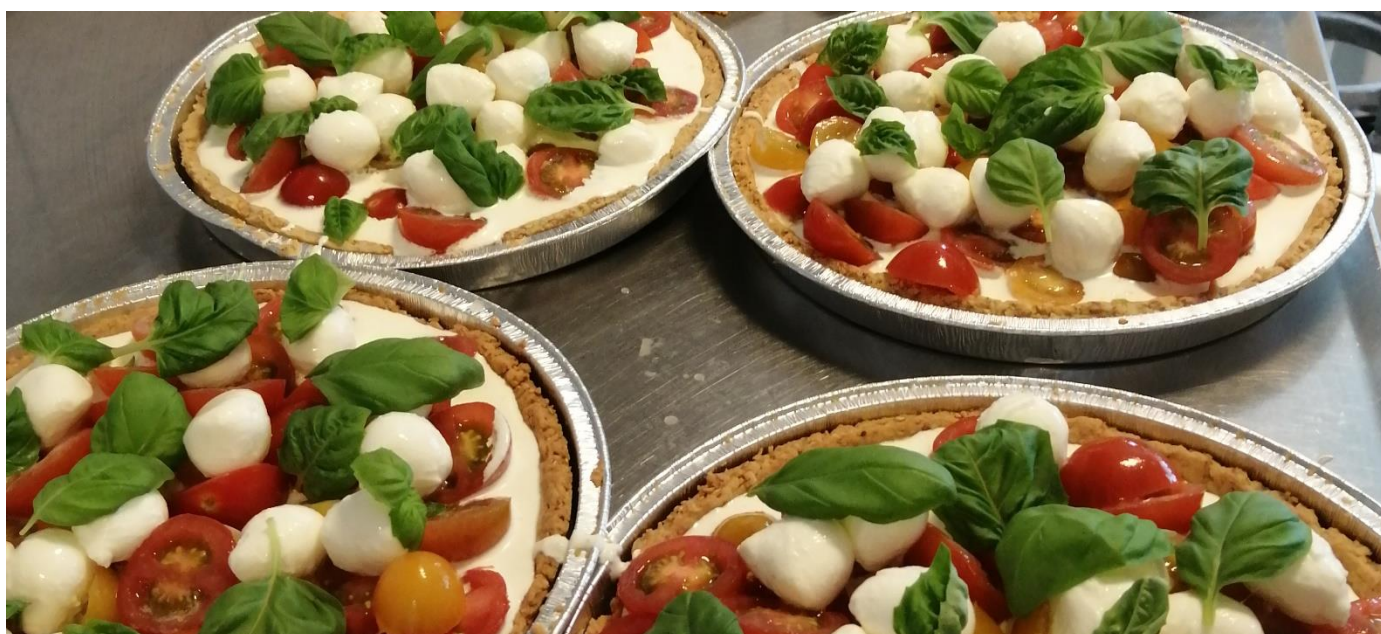
Madtærter med bl.a. cherrytomater i forskellige farver, frisk mozzarellaost og friske basilikumblade – serveret d. 12. august 2020 som forret.