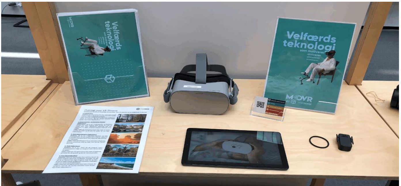
MoVR-briller ses her udstillet på en messestand for Syncsense.

Efter pilotprojektet er Holmegårdsparken og I blevet enige om at fortsætte samarbejdet omkring et næste niveau af tests. Hvorfor er I interesseret i at fortsætte samarbejdet?