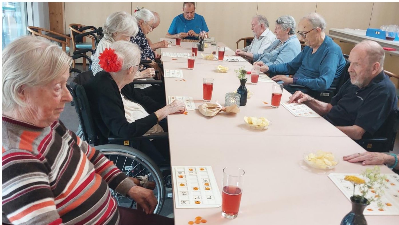
Banko i Kulturhuset er populært.