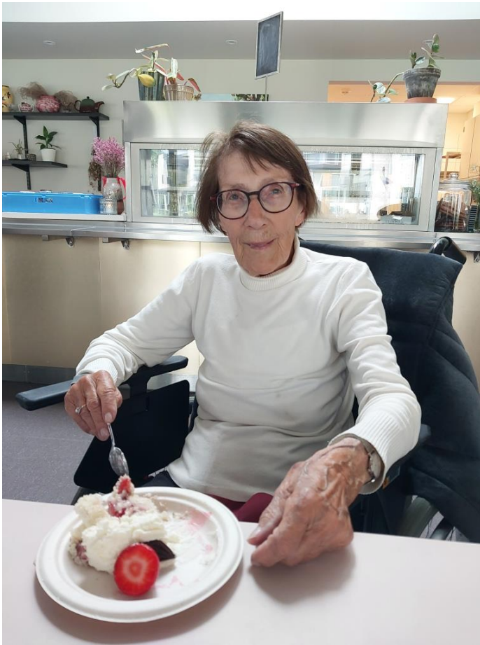
Hygge en dag i Kulturhuset