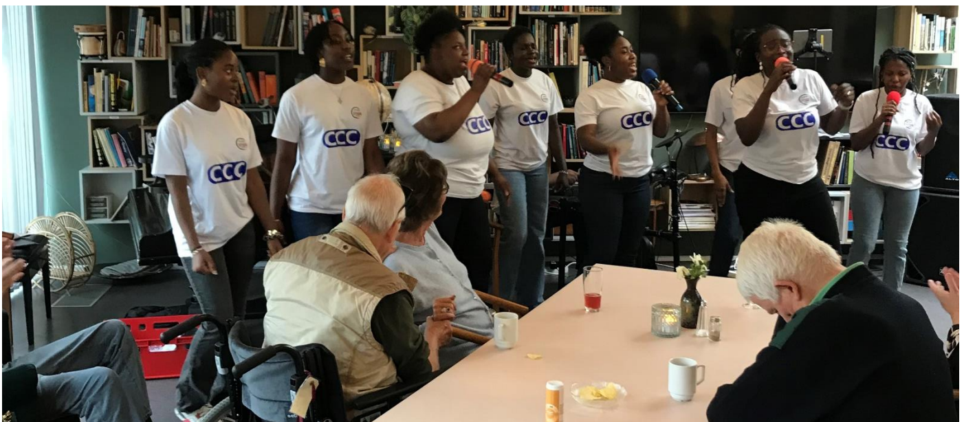
Gospelkor-koncert den 24. september

Os på Holmegårdsparken var blandt dem, der fik besøg af elever og forældre fra Skovgårdsskolen fredag d. 6. september – se foto øverst til højre. Dette takkekort kom efterfølgende til os.