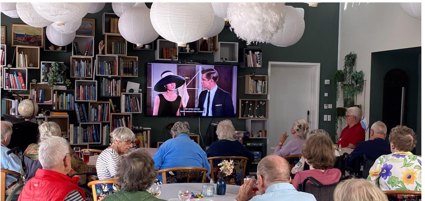
Fra filmfremvisning med “Breakfast at Tiffany’s”