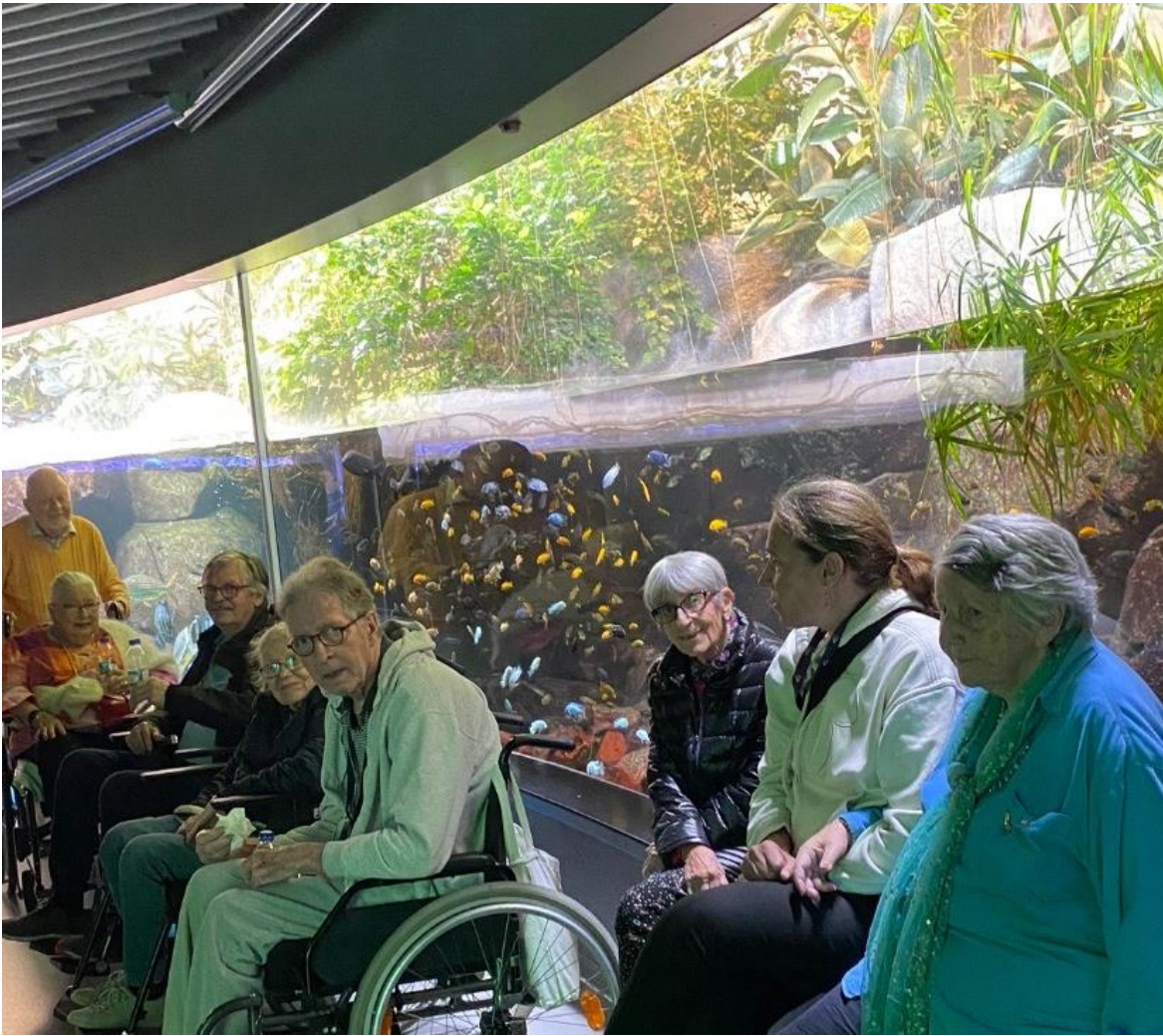
Udflugt til “Den Blå Planet” med beboer og personale fra afdeling E og F samt kulturhusmedarbejder.